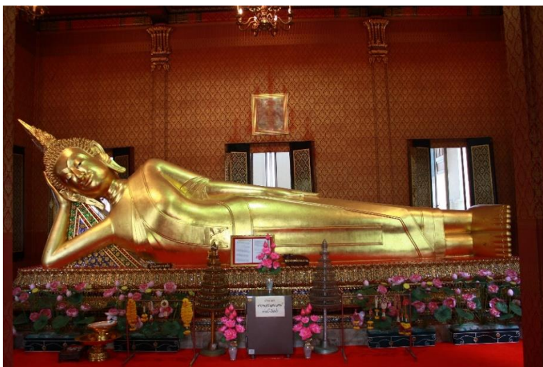
ภาพที่ ๒ พระพุทธรูปปางไสยาสน์ ภายในวิหารพระนอน วัดสามพระยาวารวิหาร