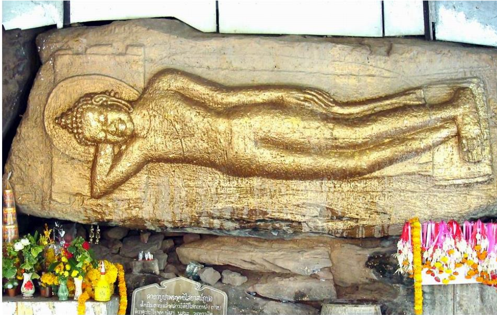
ภาพที่ ๓ พระนอนแบบสลักบนหน้าผาหินทราย พุทธสถานภูโป จังหวัดกาฬสินธุ์

คติการสร้างพระพุทธรูปไสยาสน์ไว้บนภูเขาสูงเป็นที่พบแพร่หลายในภาคตะวันออกเฉียงเหนือของไทย พบหลักฐานที่เก่าที่สุดสมัยทวารวดี เช่น ที่ภูโป อำเภอสหัสขันธ์ จังหวัดกาฬสินธุ์ สันนิษฐานว่าการสร้างพระพุทธรูปปางไสยาสน์บนภูเขานี้แสดงถึง ปางปรินิพพาน และความนิยมในการสร้างบนที่สูงอาจจะเกี่ยวข้องกับความเชื่อเรื่องนิพพานที่เป็นสิ่งสูงสุดที่เกี่ยวเนื่องกับความเชื่อเรื่องไตรภูมิโลกัสนฐาน บางองค์มีจารึกอักษรปัลลวะ ภาษามอญ เป็นหลักฐานที่กำหนดอายุได้ว่า น่าจะมีอายุตั้งแต่หลังพุทธศตวรรษที่ ๑๔ เป็นต้นมา ๖ อีกนัยหนึ่ง พระพุทธรูปไสยาสน์อาจแทนความหมายของ กุสินารา (กาสยาภาเซีย) สังเวชนียสถานอันเป็นรูปแบบศิลปะที่ใช้แทนความหมายของการปรินิพพาน หรืออาจหมายถึงคำสอนที่ว่า ทุกสิ่งล้วนไม่มีตัวตน ๗