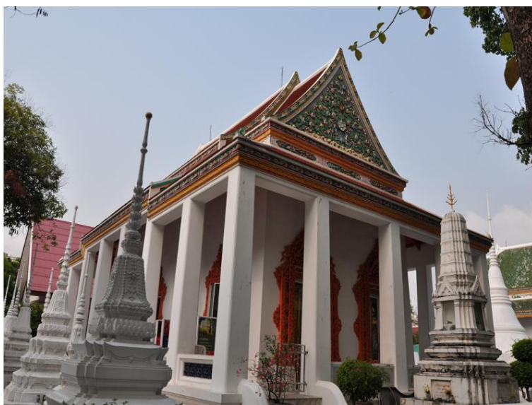
ภาพที่ ๑ อุโบสถ รูปแบบสถาปัตยกรรมแบบจีน